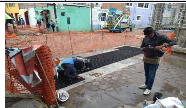
COLOCACIÓN DE REJILLA TIPO IRVING.