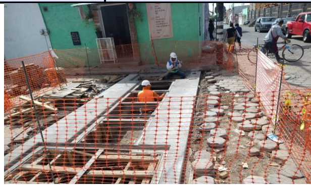
COLOCACIÓN DE PERFIL IPS DE 6"