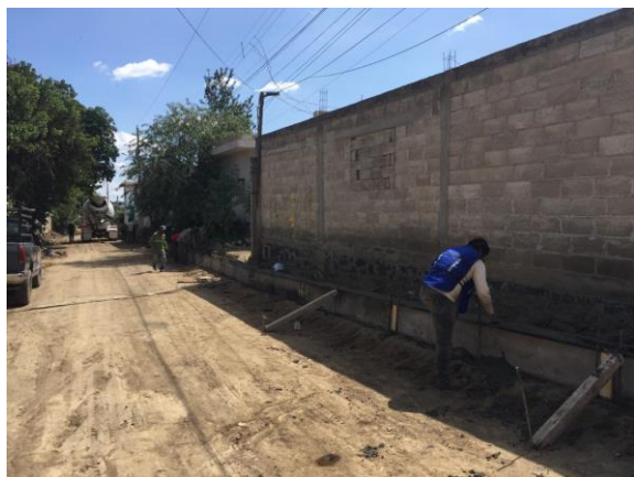
CIMBRADO DE GUARNICIÓN CON CIMBRA METALICA